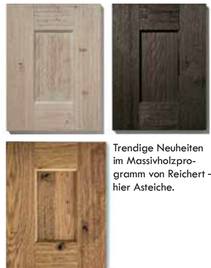
Trendige Neuheiten im Massivholzprogramm von Reichert – hier Asteiche.

Bei vielen Küchenherstellern sind derzeit Kofferfronten mit schmalen, aufge-