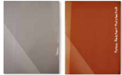
Metallic-Lackierungen sind auch für dreidimensionale Fronten möglich.

In den Produktentwicklungen von Reichert Holztechnik spiegeln sich die jeweils aktuellen Farb- und Dekortrends für eine moderne Raum- und Möbelgestaltung wider. Designs, die namhafte Möbelhersteller gerade in ihren Kollektionen präsentieren, hat jetzt der Lackspezialist in sein „Direkt“-Programm für das Handwerk aufgenommen.