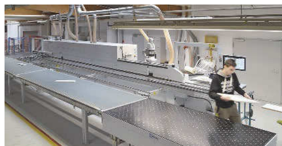
... installiert und damit das Programm ausgebaut sowie weitere Wertschöpfung ins Haus geholt