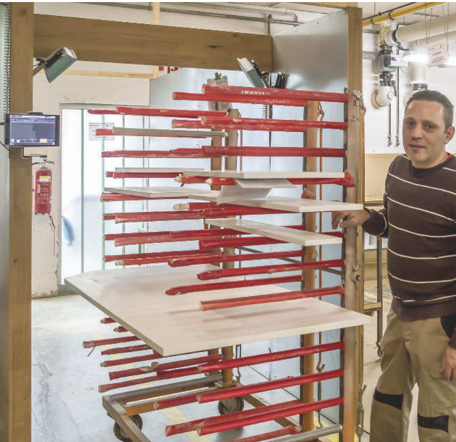
Ist die Kommission für den aufwendigen Rost-Effekt-Lack komplett beieinander? Die RFID-Pulkerkennung in dieser Kammer gibt Antwort

Mehrere ebenfalls an das ERP-System angebundene Homag-CNCs runden die Produktion ab. In 2015 hat das Team als erstes das alte ERP-System gegen 2020 Insight von 20-20 Technologies ausgetauscht. Die Implementierung hat fast drei Jahre gedauert.