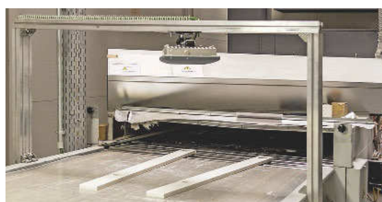
RFID-Empfänger an der Lackierstraße: Jetzt weiß das ERP-System, dass diese beiden Teile oben grundiert sind