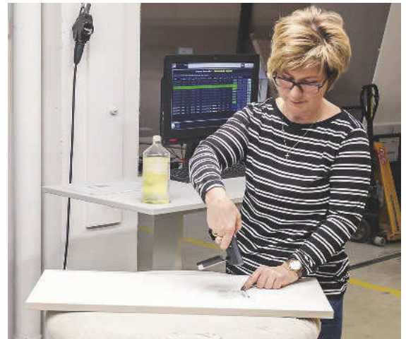
Endkontrolle mit Scanner. Sie nimmt das Teil ab, schickt es zur Reparatur oder ordert es neu ...

Weiterhin dient es als Tool für die Fertigungsplanung, den Einkauf und das Controlling. Damit 2020 stets korrekt informiert ist, hat sich das Team für eine Werkstückidentifizierung über kombinierte Barcode-RFID-Etiketten entschieden. Sie lassen sich automatisiert optisch oder per Funk lesen. Ein an der Werkstückunterseite angebrachtes RFID-Etikett lässt