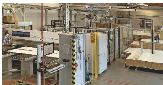
Neben ERP, RFID und Vernetzung hat Reichert noch nebenbei eine Abteilung für die Plattenbearbeitung ...

mentierte ERP-System »2020 Insight« ist stets über den Produktionsfortschritt im ganzen Werk informiert. 13 000 Möbelfronten durchlaufen jeden Monat die Fertigung. Die mittlere Auftragslosgröße zählt 20 zu lackierende Fronten. Wer das Werk besichtigt, sieht Unmengen an sauber in Reihe und Glied gepackten Hordenwagen mit Möbelfronten, die vielleicht bereits ein-, zwei- oder dreimal lackiert sind.