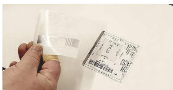
Dieses Etikett lässt sich mit Barcodescannern oder RFID-Empfängern im Durchlauf oder im Pulk lesen

Daher waren neben dem ERP-System weitere Investitionen notwendig. Eine Homag-Säge-Lager-Kombi hat weitere Wertschöpfung ins Haus geholt, den Materialfluss optimiert, den Materialverbrauch dank »Schnitt Profi(t)« reduziert und die Basis für den effizienten Teilefluss in der vernetzten Produktion geschaffen. Das Lager löst die logistischen Anforderungen am Anfang der Prozesskette. Weiterhin fügt sich eine neue Homag-Kantenleimmaschine mit Rückführung in den Fertigungsfluss ein. Diese Maschinen melden dem ERP-System das, was sie erledigt haben. Die RFID-Technik sorgt bei den nächsten Arbeitsschritten für Zeitersparnis, Transparenz und Kostenkontrolle.