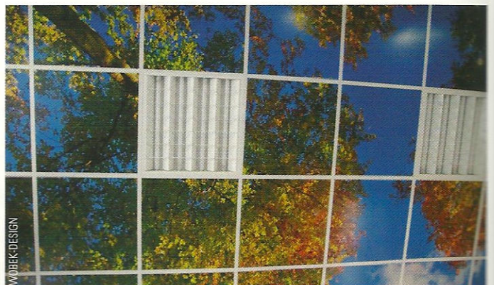
Metallkassettendecke mit Herbsthimmel.

der Motive sorgt, lassen sich auf ebenen Blechen mit Maximalmaßen von 2,0 x 3,0 m freigestaltete, mehrfarbige Bilder, Fotos, Zeichnungen und Dekore darstellen. ■